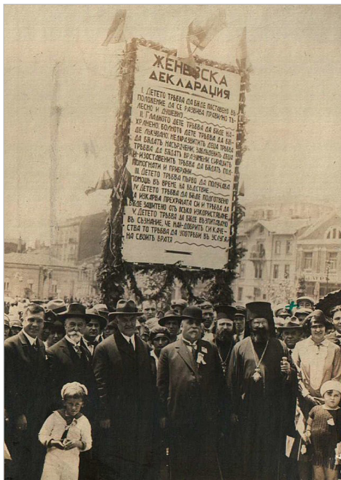
Praznovanje Svetovnega dneva otrok v Bolgariji leta 1928, ki je bil razglašen leta 1925 v Genevi po sprejemu Ženevske deklaracije o otrokovih pravicah (1924)

ale in prava. Prvi mednarodni dokument, ki je priznal obstoj posebnih pravic, ki pripadajo otroku, je bila Ženevska deklaracija o otrokovih pravicah , sprejeta leta 1924. Ženevska deklaracija je otroku priznala pravico, da mora biti varovan pred vsemi oblikami izkoriščanja ter da mu je potrebno omogočiti ustrezen telesni in duševni razvoj. 21 Deklaracija, sestavljena iz petih temeljnih načel, je uvodoma poudarila načelo nediskriminacije, kar pomeni, da mora človeštvo dati otroku najboljše, kar premore, ne glede na to, kakšna je njegova rasa, naro-