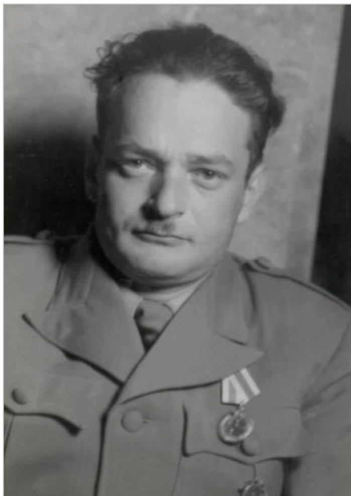
Boris Kidrič