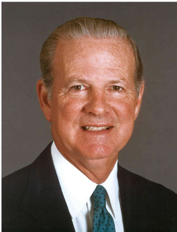
Državni sekretar ZDA James Baker