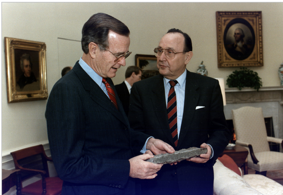
Ameriški predsednik George H. W. Bush in nemški zunanji minister Hans-Dietrich Genscher

najsterice v Haagu, so v Sloveniji zopet izbruhnili spopadi. Tedaj je bila zunanja politika EGS v Nemčiji deležna hudih kritik. Na srečanju so kljub temu sprejeli Deklaracijo o Jugoslaviji in sklenili ponovno poslati "ministrsko trojko". V Deklaraciji so zahtevali zamrznitev vseh odločitev o samostojnosti od 25. junija 1991 dalje in takojšnji začetek pogajanj brez predpogojev; podprli so tudi pravico do samoodločbe z upoštevanjem ozemeljske celovitosti držav. Nemčija je zahtevala vnos formulacije, da bo EGS ob morebitni kršitvi premirja ponovno pretehtala stališče do neodvisnosti Slovenije in Hrvaške, 75 s čimer je minister Genscher na svetu ministrov EGS prvič nakazal možnost mednarodnega priznanja Slovenije in Hrvaške. 76