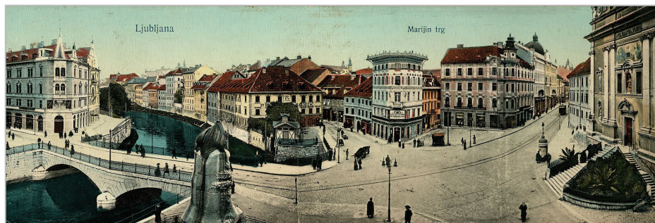
Današnji Prešernov trg leta 1912

planinskega društva, Sokol in Turnverein, Družba sv. Cirila in Metoda in Deutscher Schulverein. 86 Vsaka stran je imela v Ljubljani svoja središča in zbirališča – slovenski Narodni dom in nemška Kazina. V drugih večjih mestih (Maribor, Celje, Ptuj) je bilo podobno. 87 Napetosti med obema stranema so vrelišče dosegla septembra 1908, ko je bilo zaradi napadov na Slovence na Ptuj v Ljubljani (v petek 18. septembra) organizirano protestno zborovanje. 88 Sledilo je odstranjevanje nemških napisov z lokalov in s to akcijo je mesto dokončno dobilo slovensko podobo. 89