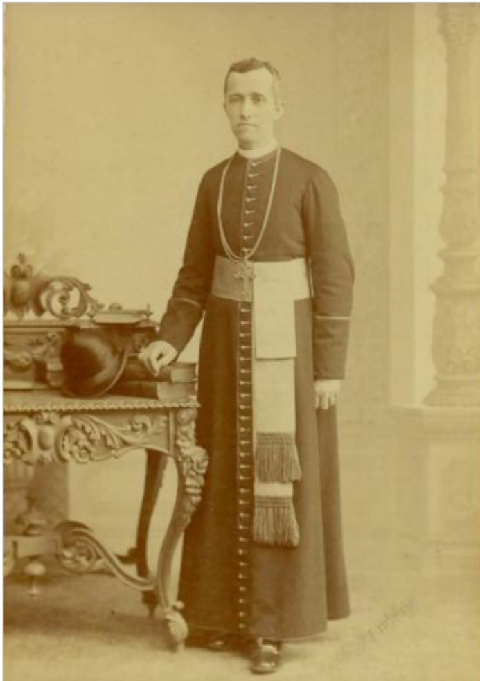
Anton Bonaventura Jeglič

ljubljanska akademska gimnazija je leta 1900 dobila naziv I. državna, potem ko so leta 1899 ustanovili drugo gimnazijo, ki je dobila naziv II. državna. Nemška manjšina je leta 1907 izsilila ustanovitev III. državne gimnazije z nemškim učnim jezikom, medtem ko je bil na prvih dveh pouk dvojezičen. Strogo nemški duh je vladal na realki (ustanovljeni leta 1851). Škofijska klasična gimnazija je bila vse do leta 1918 edina popolnoma slovenska gimnazija. 70