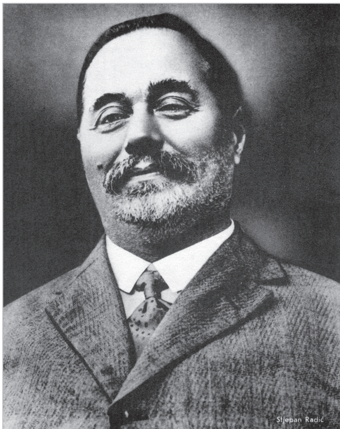
Stjepan Radić