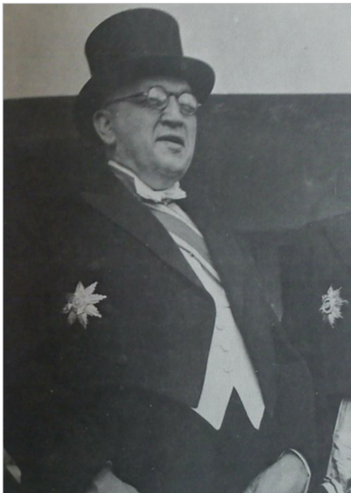
Anton Korošec

nad Slovenijo v resnici". Sledilo je hudomušno vprašanje slovenskim katoliškim narodnjakom, "ali bi oni postavili za kandidata v Sloveniji kakšnega hrvaškega duhovnika". 62